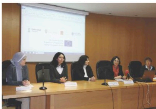
Representantes de las universidades que participan en el proyecto Gesport durante su reunión en Teruel el pasado enero

Además del concurso de logo y la puesta en marcha de la web, continúan la labor investigadora de las universidades implicadas y el próximo mes de julio se reunirán en Italia para poner en común los avances.